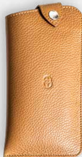
Pouzdro na brýle Barvy: černá, modrá, hnědá, světle hnědá, porcelánová