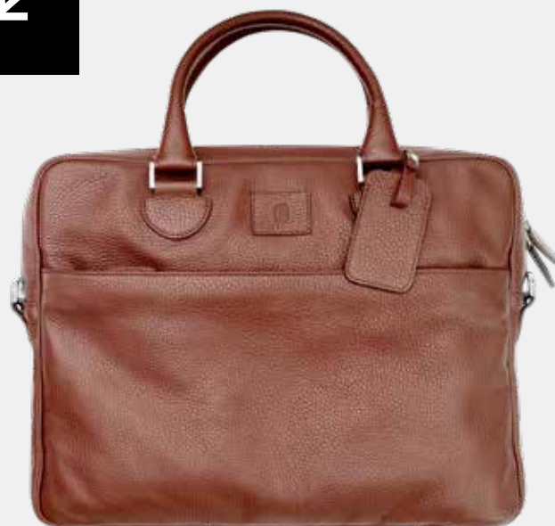
Taška na notebook Barvy: černá, modrá, hnědá, světle hnědá, porcelánová ROZMĚRY: 30 x 40 x 6 cm