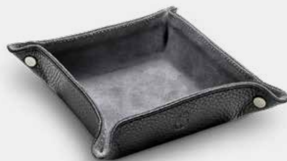
Odkladač na hodinky Barvy: černá, modrá, hnědá, světle hnědá, porcelánová