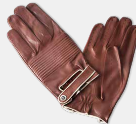
Racing rukavice A.M. 49 – ve spolupráci se značkou Engelmüller. Limitovaná edice k příležitosti historického vítězství Aero Minor na prestižním závodě 24 hodin Le Mans v roce 1949.