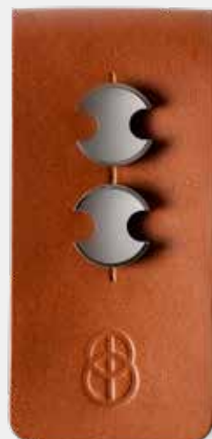
Manžetové knoflíčky Ocelové, s ručně leštěnou fazetou.