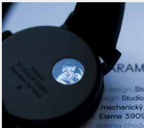
Zadní stranu hodinek zdobí průhled do srdce mechanického strojeku.

„Dobrý vizuální design musí chtít širokou veřejnost povznést a učit ji rozpoznávat kvalitu.“