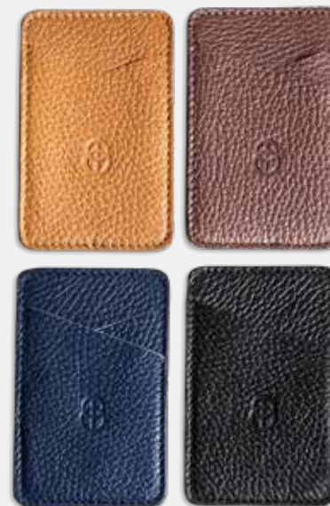
Vizitkovník Barvy: černá, modrá, hnědá, světle hnědá