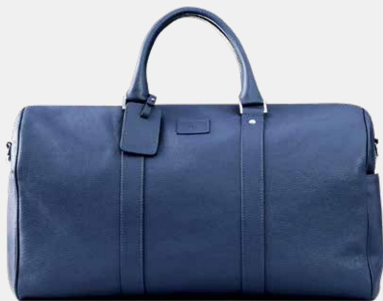
Cestovní taška Barvy: černá, modrá, hnědá, světle hnědá ROZMĚRY: 50 x 30 x 24 cm Součástí je praktický celokožený ramenní popruh, kožená jmenovka.

K hodinkám nabízíme rovněž reprezentativní doplňky. Vyrábí se v řemeslných dílnách v České republice z vysoce kvalitních materiálů: italské měkké hovězí kůže s oblázkovým zrnem, kvalitní leštěné oceli či slavného českého broušeného skla.