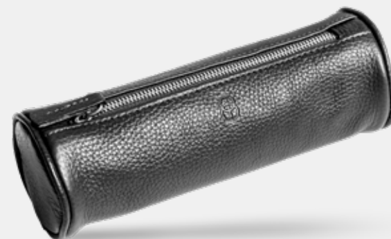
Cestovní pouzdro na toaletní potřeby Barvy: černá, modrá, hnědá, světle hnědá