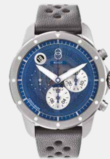
LE MANS BLUE