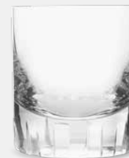
Nápojová sada na whisky ve spolupráci se značkou Moser. Sada sestávající z karafy se zabroušenou zátkou a dvou skleniček.