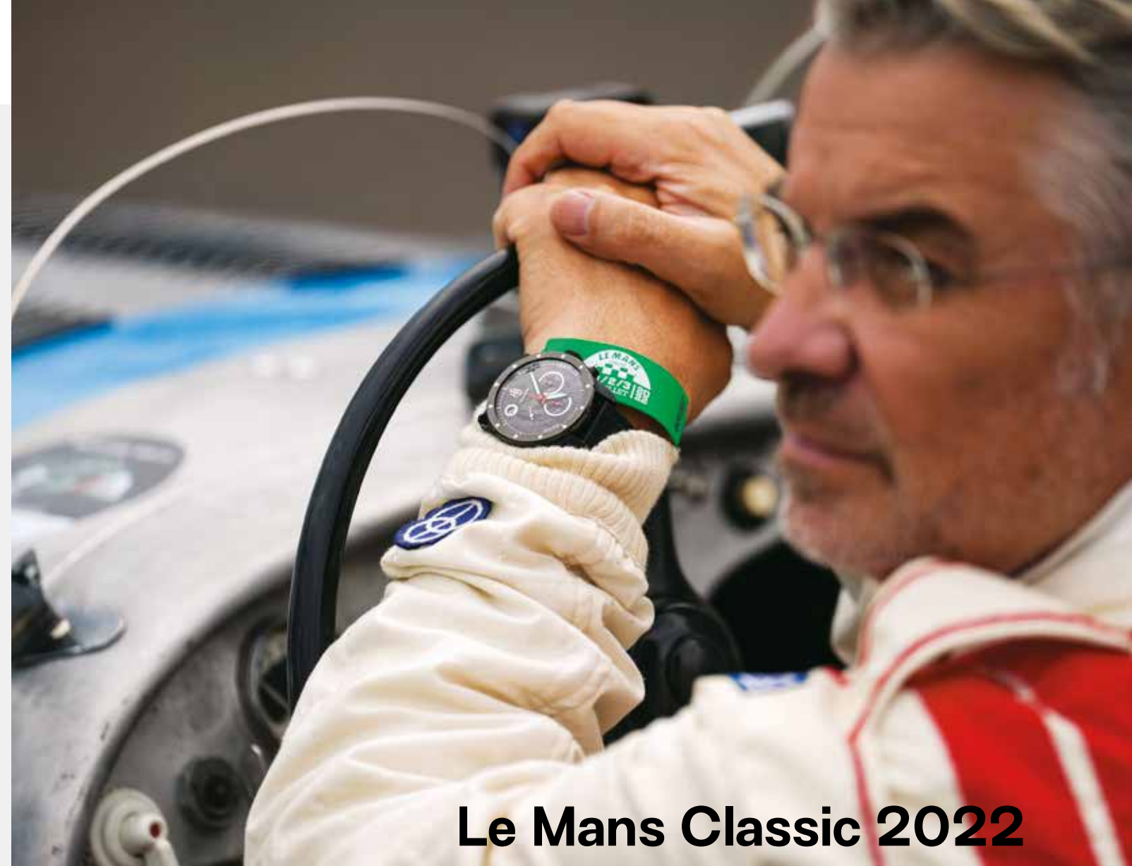
Le Mans Classic 2022